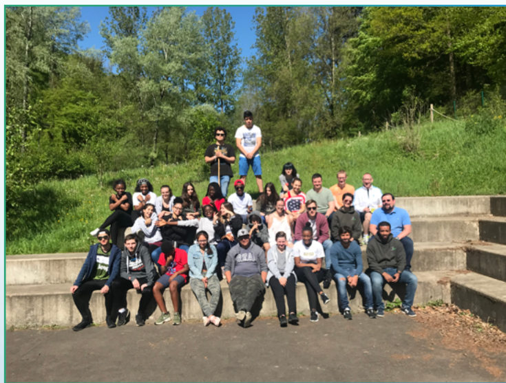
« Peer-Mediation Training » du Lycée Belval à Larochette le 6 mai 2018

https://ssl.education.lu/ifen/descriptionformation?idFormation=204827